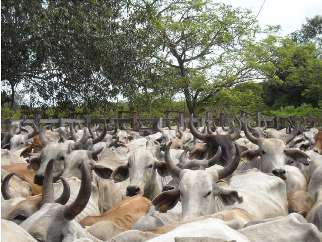
Grupo de bovinos identificados en la Zona de Alta Vigilancia - ZAV

El SINIGAN es usado como herramienta de apoyo de los diferentes programas ejecutados por la autoridad sanitaria, permitiendo realizar controles en el registro de predios pecuarios, vacunaciones obligatorias, movilizaciones, cambio de propiedad y sacrificios.