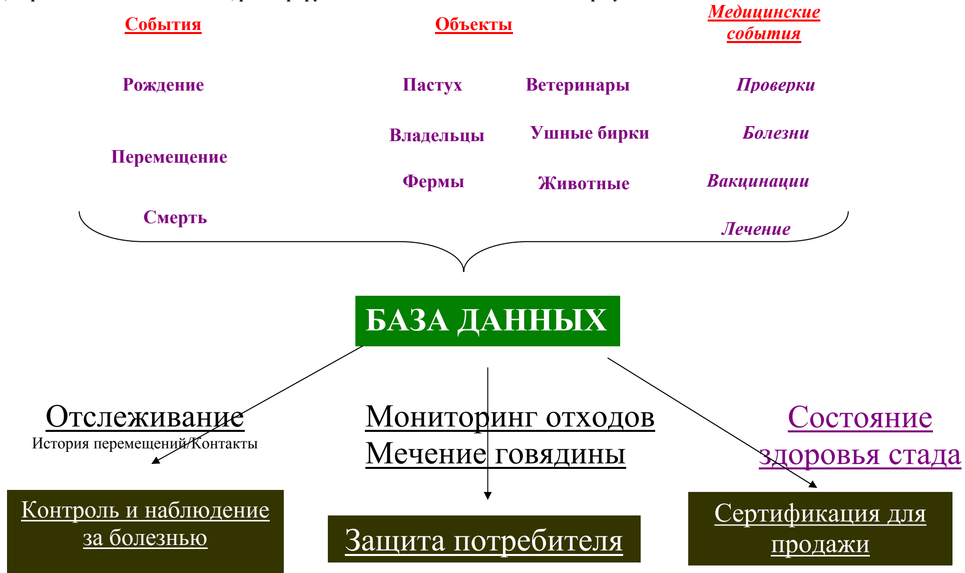
Диаграмма 4: События и записи, регистрируемые в базе данных I&R и основные результаты действий