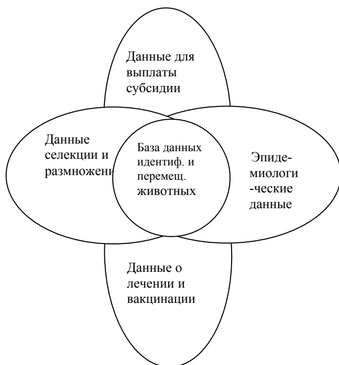
Диаграмма 2: Основная часть системы интегрированной базы данных (база данных идентификации и перемещений животных и элементы, пригодные для возможной интеграции)

На диаграмме 3 показан ввод и вывод данных из интегрированной базы данных I&R с различными модулями.