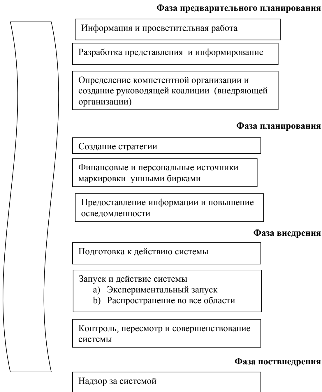
Диаграмма 5 : Фазы с описание действий в каждой фазе