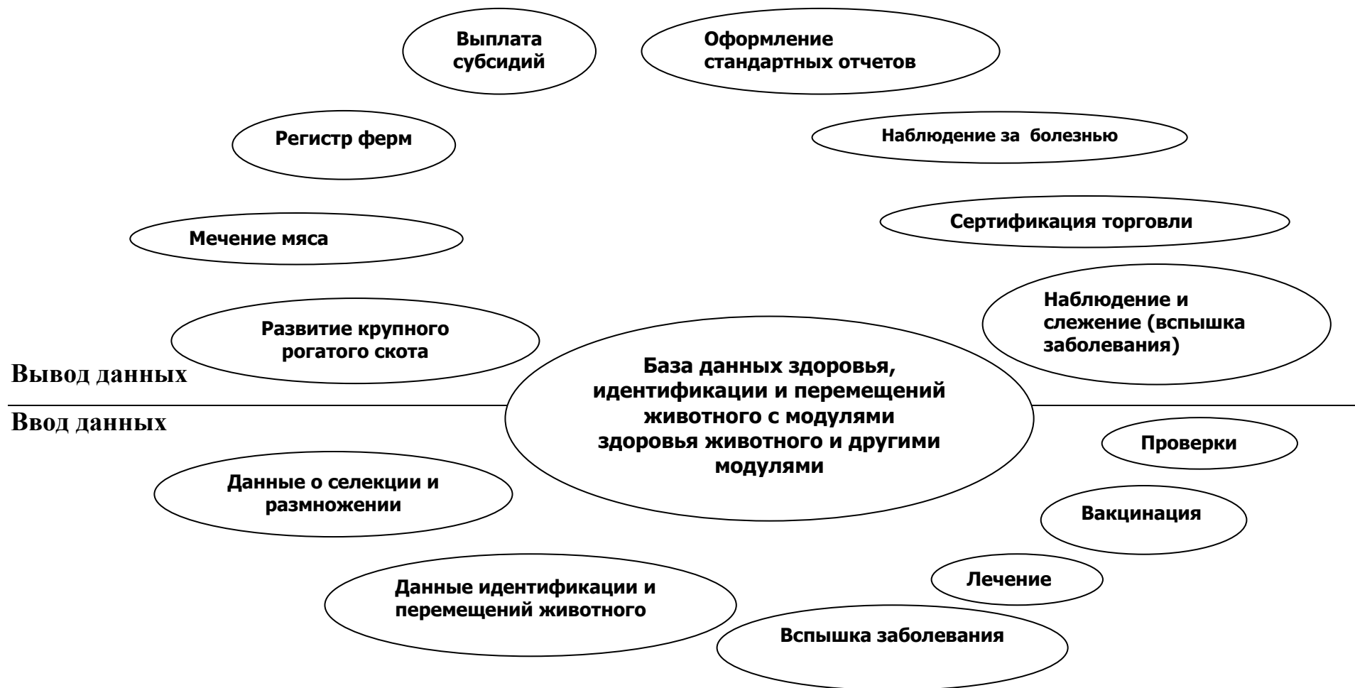
Диаграмма 3: Интегрированная база данных идентификации и перемещений животных с различными модулями