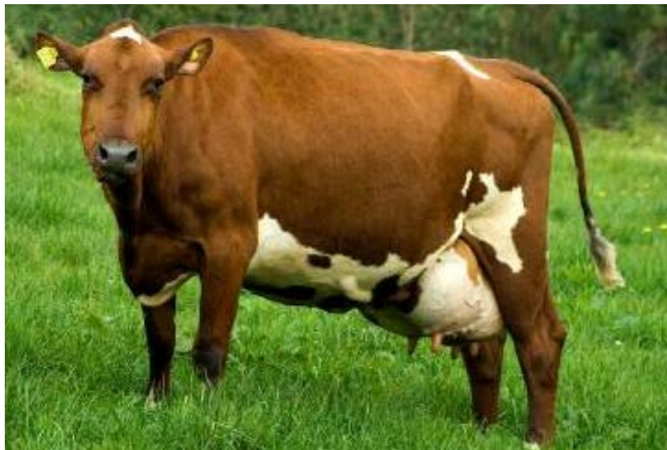
Foto 4. Vaca Ayrshire identificada y registrada oficialmente en SINIGAN.

La estrategia operacional del SINIGAN integró éste en la cadena productiva, de forma que ninguno de los integrantes de ésta cambien sus sistemas internos de toma, manejo y control de la información. Esta estrategia permitió la posibilidad de almacenar información y realizar el intercambio de ésta entre los productores y la industria en una base de datos única, lo cual permite que los consumidores tengan la posibilidad de obtener directamente, a través del portal web del SINIGAN, la información de origen del producto. Esta información se puede suministrar de manera agregada, por zona o en casos muy puntuales por explotación ganadera.