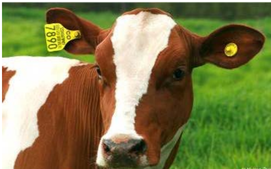
Foto 1. Novilla Ayrshire identificada y registrada oficialmente en SINIGAN.

Las instituciones responsables han definido acciones a través del establecimiento de una serie de normas, convenios y resoluciones que los ganaderos, industriales y comercializadores, como usuarios del Sistema, han estudiado cuidadosamente para establecer la logística de la puesta en marcha y operación, y han implementado acciones, a corto y medio plazo.