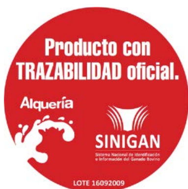
Foto 5. Logotipo de identificación de productos trazados.

La comercialización de productos lácteos con origen en explotaciones ganaderas que tienen implementado el SINIGAN, no tiene en el mercado valor agregado, pero sí representa beneficios valiosos para diferenciar su producto, como: