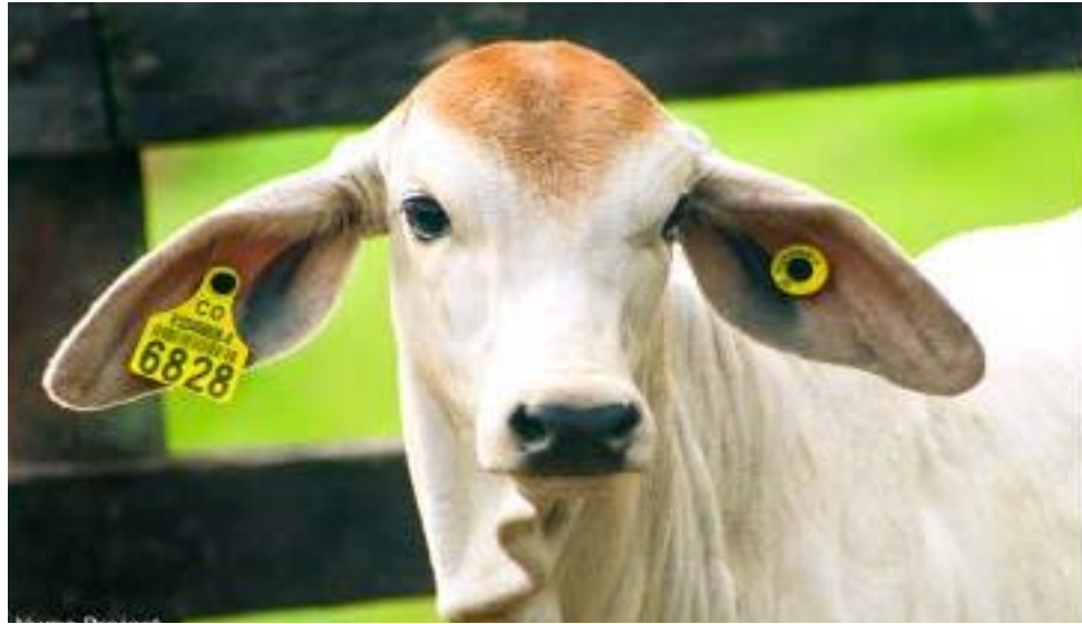
Foto 2. Ternera Brahman identificada y registrada oficialmente en SINIGAN.