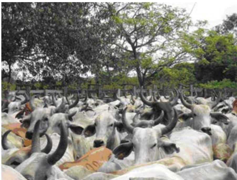
Grupo de bovinos identificados en la Zona de Alta Vigilancia - ZAV